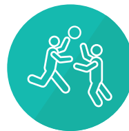
Cultura, recreación, deporte y actividad física