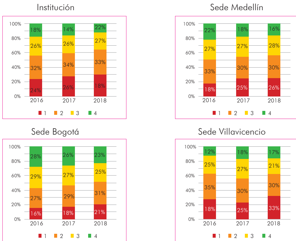
Gráfica 1. Porcentaje de estudiantes por niveles de desempeño en Lectura crítica

niveles de agregación, a excepción de la sede Villavicencio (gráfica 1). El resultado desagregado por aplicación muestra que el porcentaje de estudiantes en el nivel de desempeño 1 en la aplicación 2018 es mayor al obtenido en 2017 y 2016. Este comportamiento es contrario al analizar el nivel de desempeño 4.