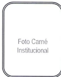
Foto Carné Institucional

Seleccione el Consejo al que se presenta: