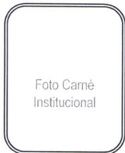
Foto Carné Institucional